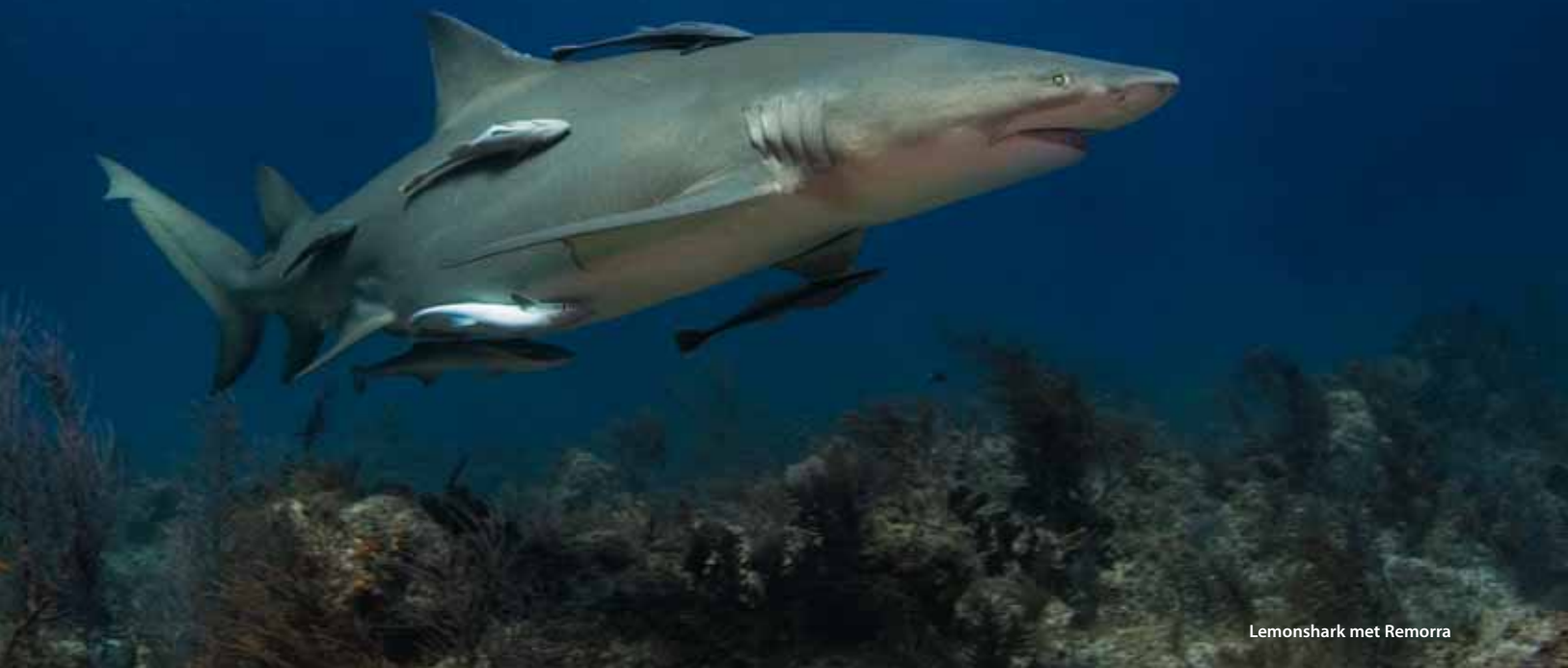
Lemonshark met Remorra

bang dat zijn 'girls' (het zijn allemaal vrouwtjes haaien, niemand weet waarom) worden weggevangen door de 'longliners'. Het is bijzonder zoals hij en ook zijn bemanning met liefde over hun haaien spreken. Ze hebben de 'vaste' tijgerhaaien namen gegeven en zelfs een echt 'smoelenboek' gemaakt.