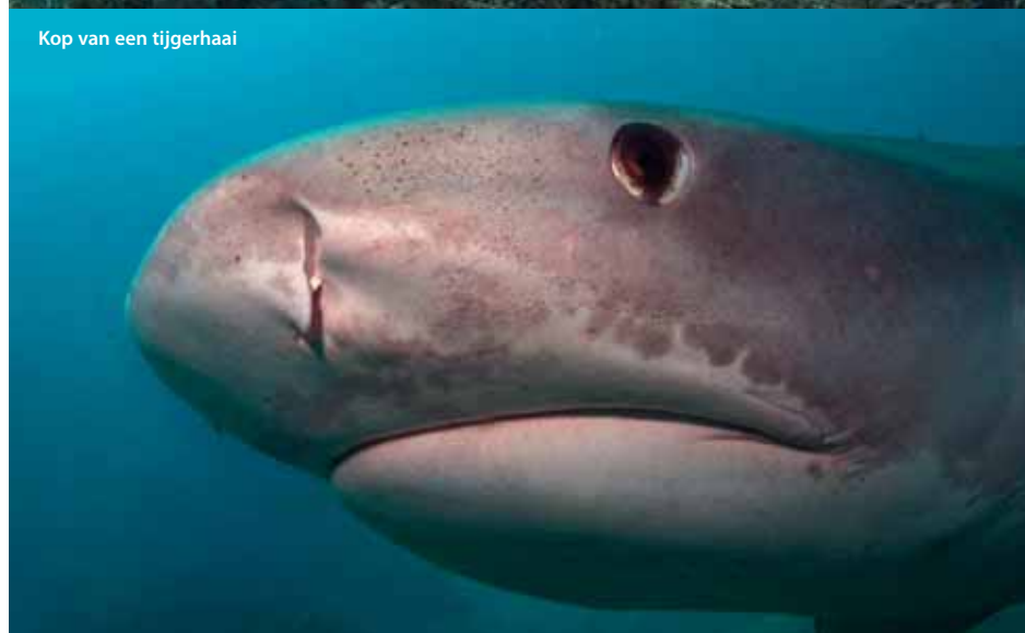
Kop van een tijgerhaai