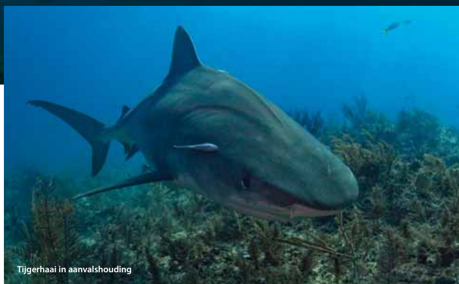
Tijgerhaai in aanvalshouding

ANKERTOUW LOS Die week nog een opmerkelijk moment als de boot weg is. Wel