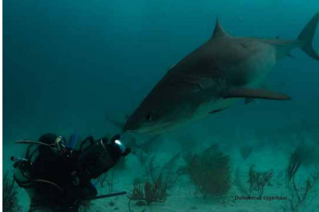
Duiker met tijgerhaai

GEHEIM De locatie is 'ergens' in de Bahama's. Waar precies is niet bekend. In de buurt van het eiland Grand Bahama. Zelfs de stuurman schijnt niet de geheime coördinaten van de kapitein te weten. Abernethy is veel te